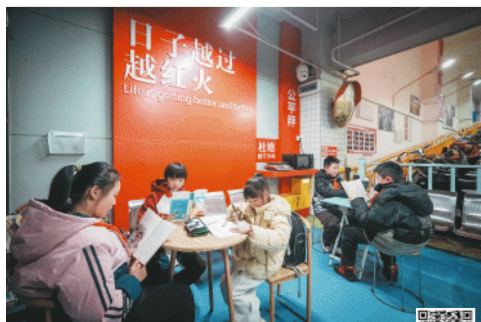
孩子们在“4点半角”的明亮灯光下写作业、读书。扫码看辣视频 感受“4点半角”